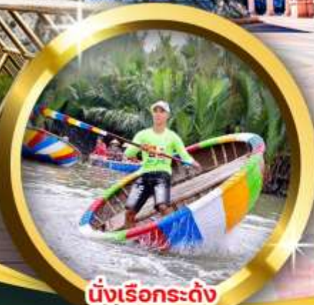
นั่งเรือกระดิ่ง