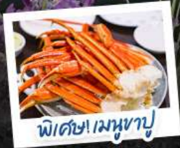
พิเศษ! เมฆาบู