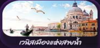
เวนิสเมืองแห่งสายน้ำ

พลอเรนซสติก, พิซซามาการิตา, สปาเก็ตตีหมึกดำ, หอยเอสคาโท