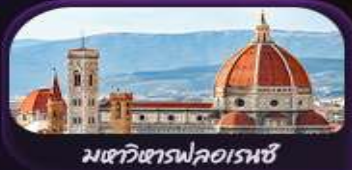
มหาวิหารฟลอเรนซ์