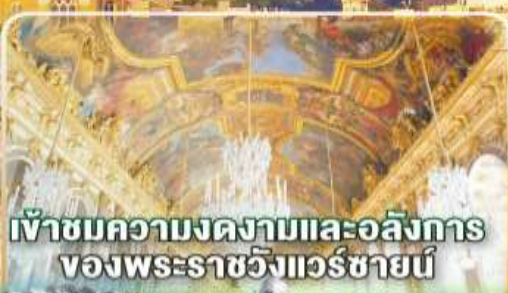
เข้าชมความงดงามและอลังการ ของพระราชวังแวร์ซายน์