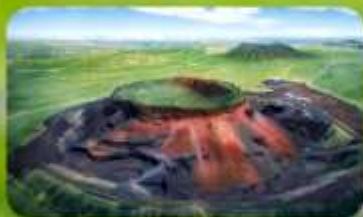
ภูเขาไฟอูลันคา