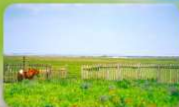
ทุ่งหญ้าออร์คอส