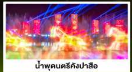
น้ำพุคนครึ่งคังปาลิโอ