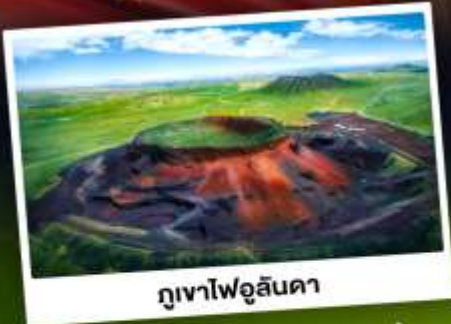
ภูเขาไฟอูลันดา

ท่องเที่ยวแดนแห่งทะเลทรายและทุ่งหญ้า ชมพระอาทิตย์ขึ้นทุ่งหญ้าออร์ดอส