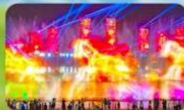
น้ำพุคนตรีคังปาสือ