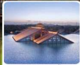
พิพิธภัณฑ์ไดน้ำ กวางฟู่หลิน