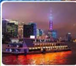
ส่องเรือแม่น้ำหวงผู่