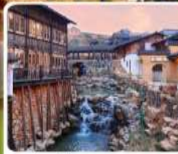
เมืองโบราณเหย้าหู