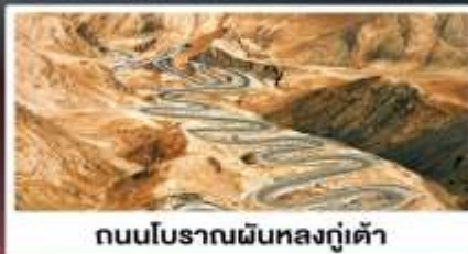
ถนนโบราณผืนหลงกู่เต้า