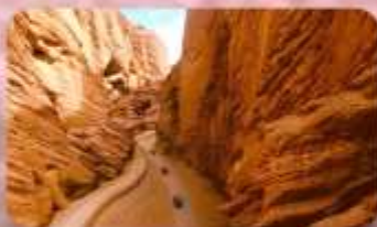
แกรนด์แคนยอนอาจูซือ