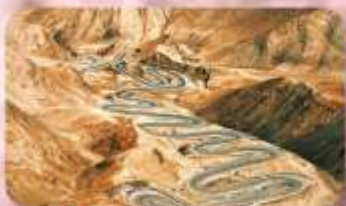
ถนนโบราณผืนหลงกุ้เต้า