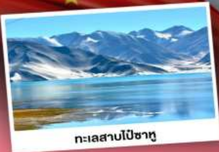
ทะเลสาบไปซาทุ

เปิดประตูสู่อารยธรรมพันปีแห่งซินเจียงใต้ ชมความสวยงามของหมู่บ้านดอกแอปเปิ้ล