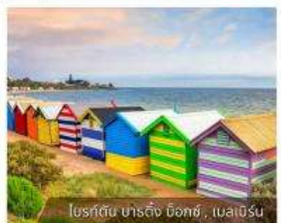
โบสถ์ต้น ชาร์ลส์ บ็อกซ์, เมลเบิร์น