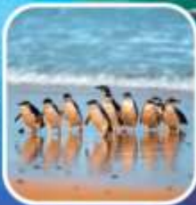
เพนกวินที่เกาะฟิลลิป