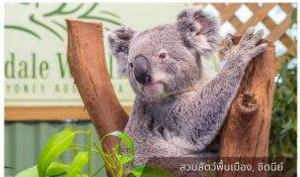
สวนสัตว์พื้นเมือง, ซิดนีย์