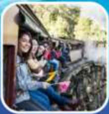
รถไฟจักรไอน้ำโบราณ