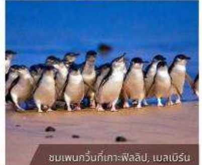
ชมเพนกวินที่เกาะฟิลลิป, เมลเบิร์น