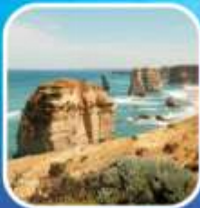
Great Ocean Road (ครึ่งสาย)