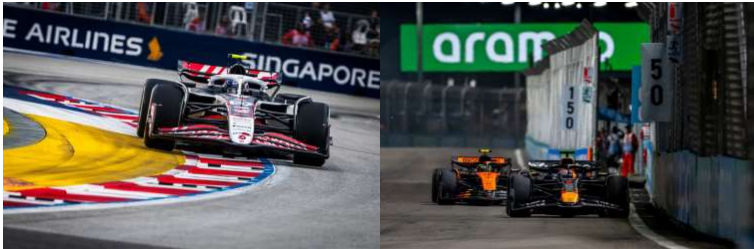
ชม รอบ SPRINT RACE + QUALIFYING

**เดินทางด้วยตนเอง เข้าร่วมงาน FORMULA 1 SINGAPORE GRAND PRIX 2026**